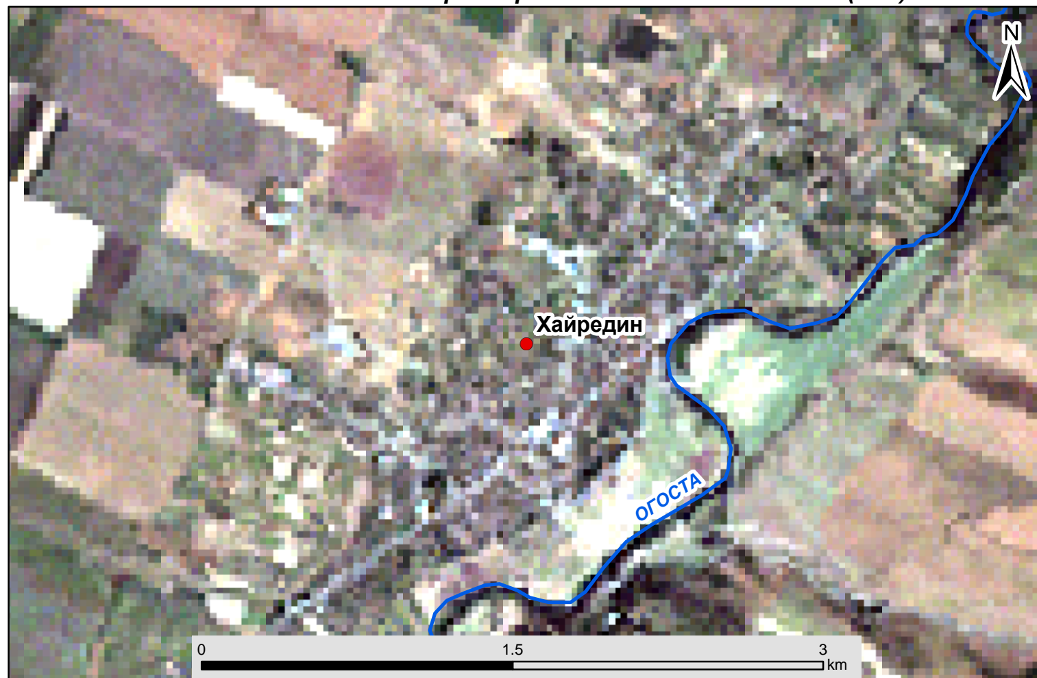
Спътникова снимка на гр. Хайредин от спътник Landsat (30м)