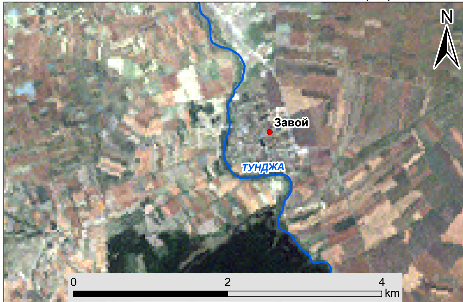
Спътникова снимка на с. Завой от спътник Landsat (30м)