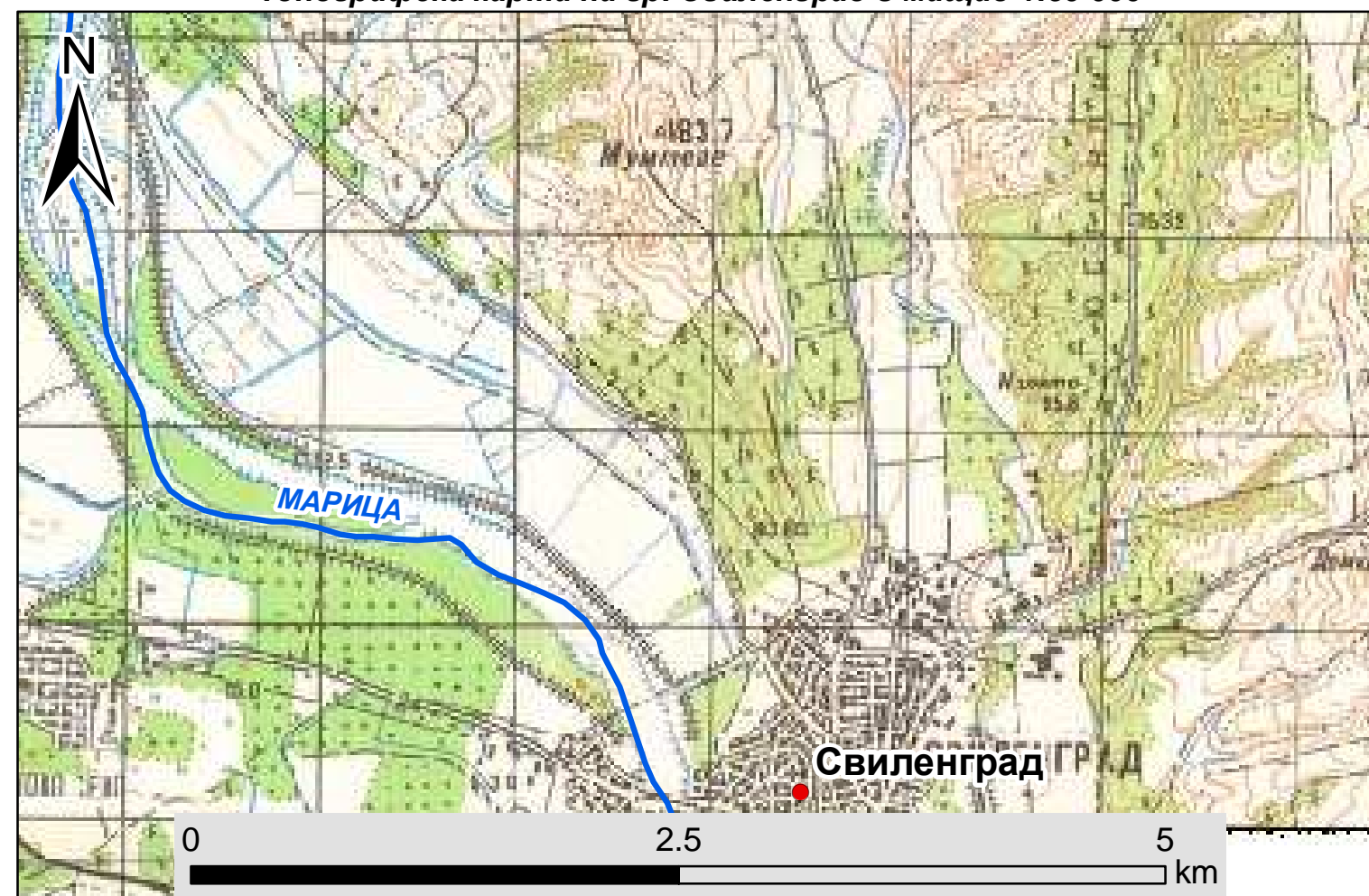
Топографска карта на гр. Свиленград в мащаб 1:50 000