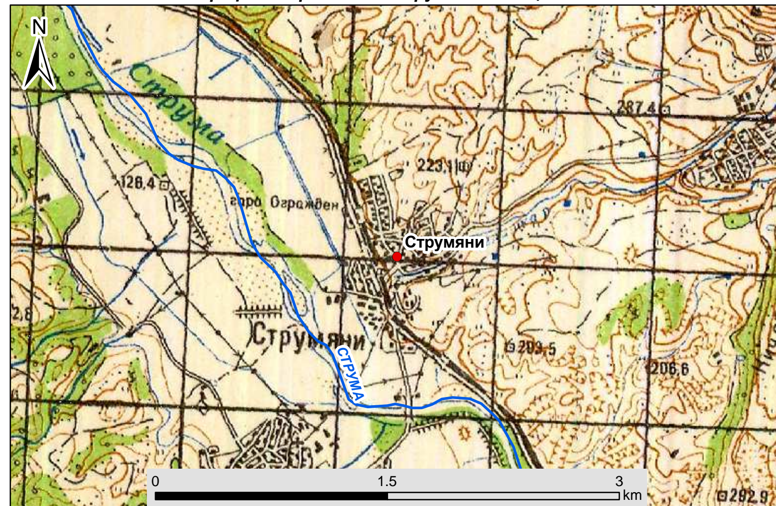
Топографска карта на с. Струмяни в мащаб 1:50 000