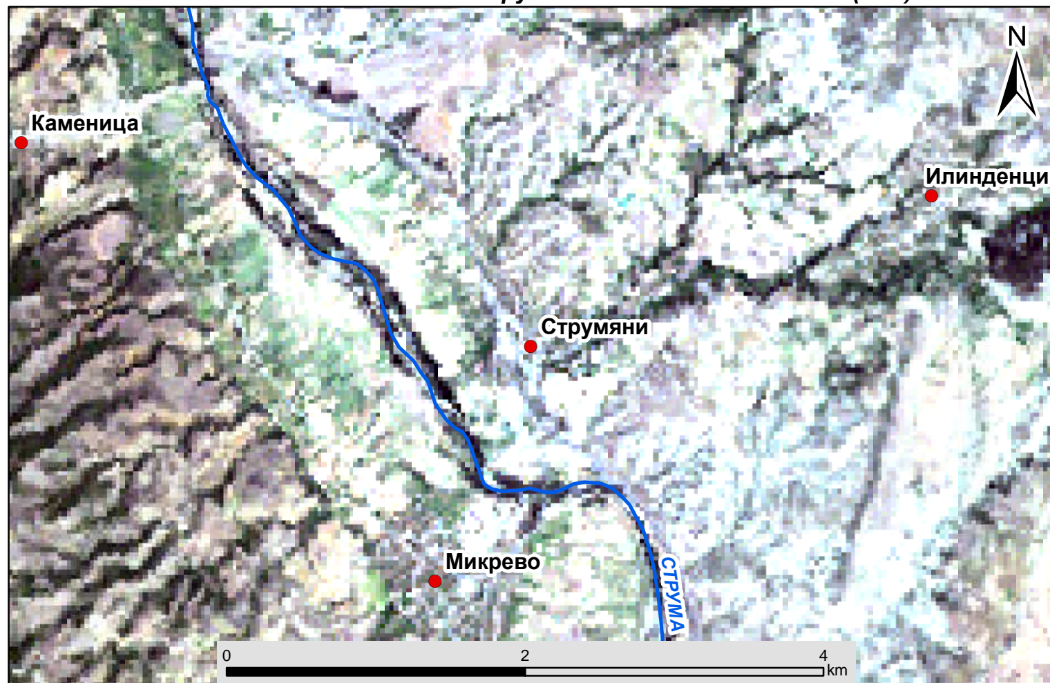
Спътникова снимка на с. Струмяни от спътник Landsat (30м)