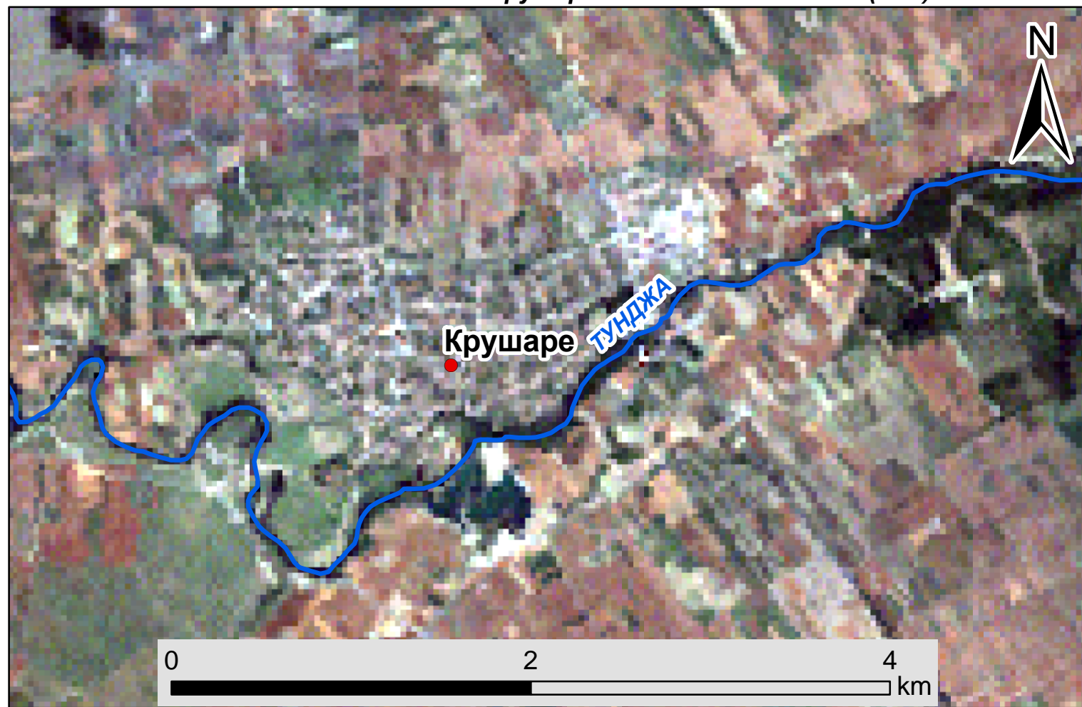
Сътникова снимка на с. Крушаре от спътник Landsat (30м)