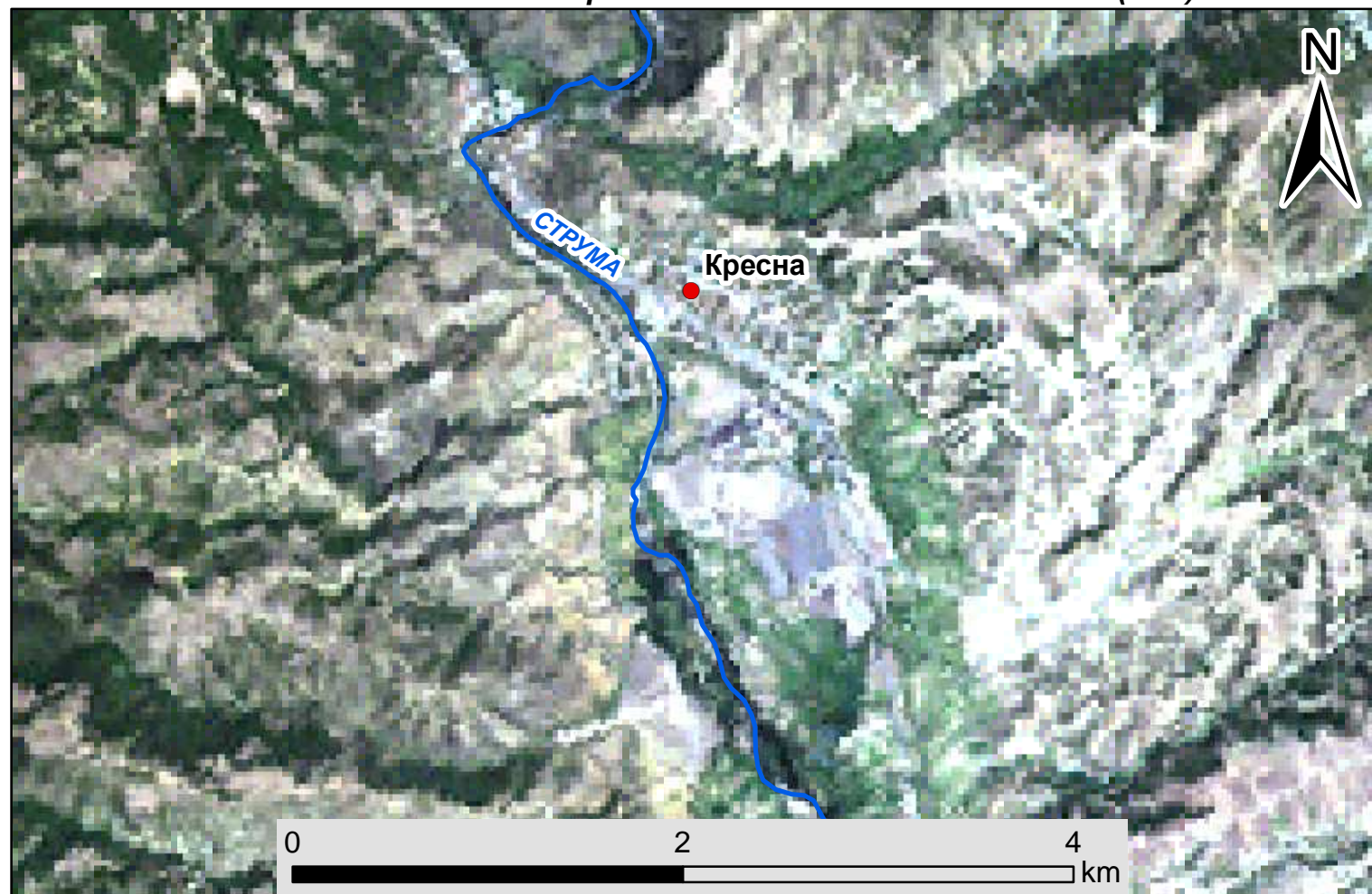
Сътникова снимка на гр. Симитли от спътник Landsat (30м)