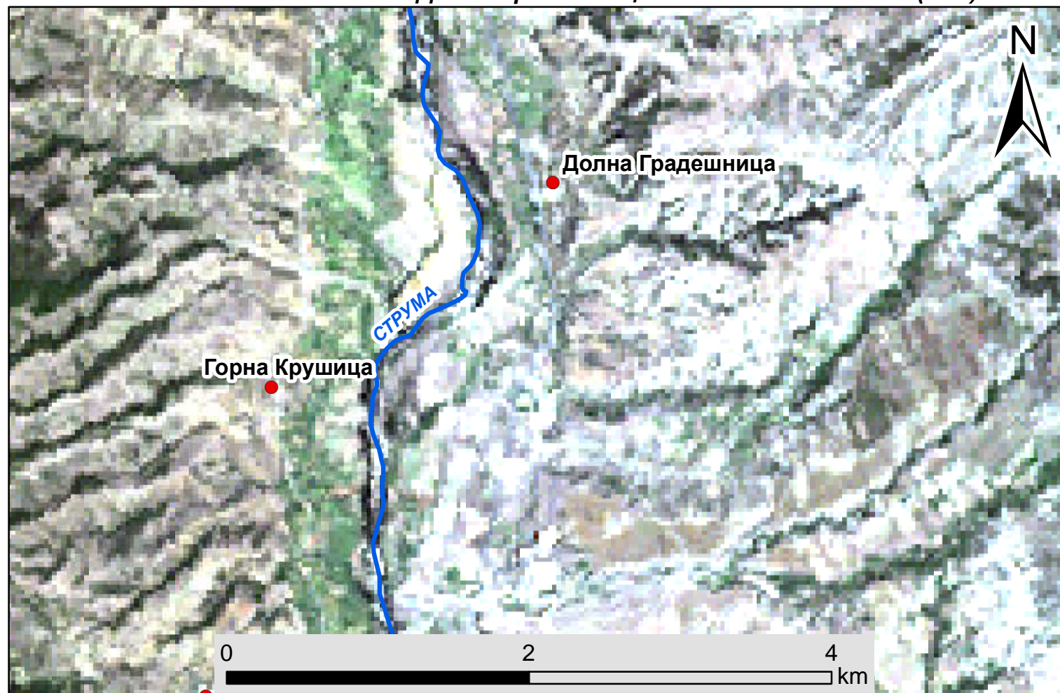
Сътникова снимка на с. Долна Градешница от спътник Landsat (30м)