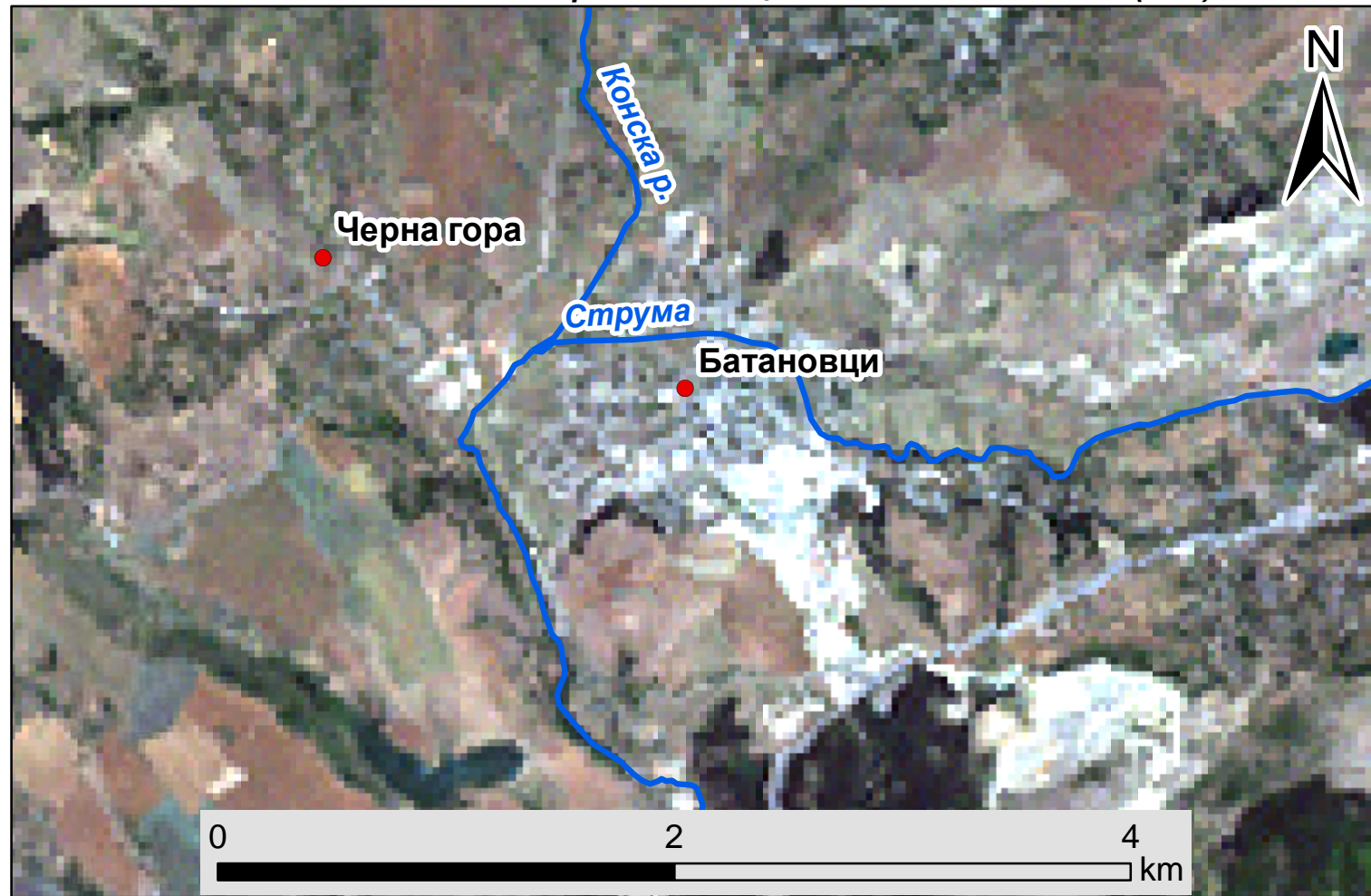
Съпътникова снимка на гр. Батановци от спътник Landsat (30м)